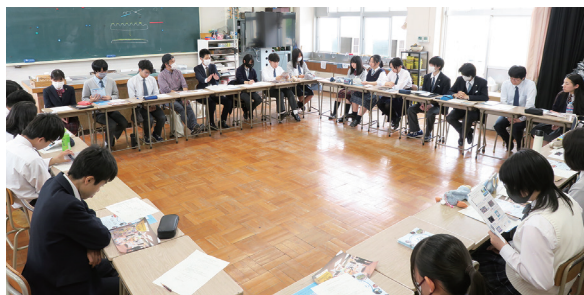
美術系 3回目の打ち合わせの様子

一方、美術系は2024年11月に香川県障害福祉課より、美術系担当教員を通じて、ファサードの制作依頼を受けました。香川県障害福祉課、本校教員、運営担当者(障害福祉サービス事業所)で2回打ち合わせを行い、その協議内容を生徒に伝えました。依頼内容を聞いた生徒はデザインの案を1から考えつつ、(生徒に主体性を持たせるために)生徒のグループの中にイベント運営会社に見立てた組織を編成し、社長・副社長をはじめ、企画部・デザイン部・制作部など役割を分担しました。