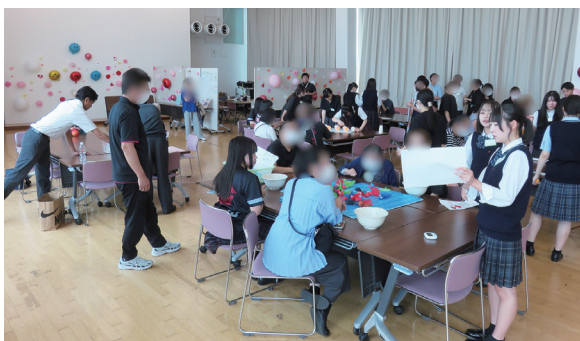
福祉系「にこちゃんかふえ」レクリエーションの様子

福祉系では、9月の英明祭に申し込んだ方(地域の方、高齢者の方、他校の教員)に参加してもらい、「にこちゃんかふえ」を運営しました。9月12日(金)は校内でリハーサルを行い、9月13日(土)当日は外部スタッフ7人、卒業生3人、お客様23人が参加しました。チラシは美術系に依頼し、制作してもらったものを高松市地域包括支援センターと体験で行った認知症カフェに事前配付し、SNSも活用して宣伝しました。