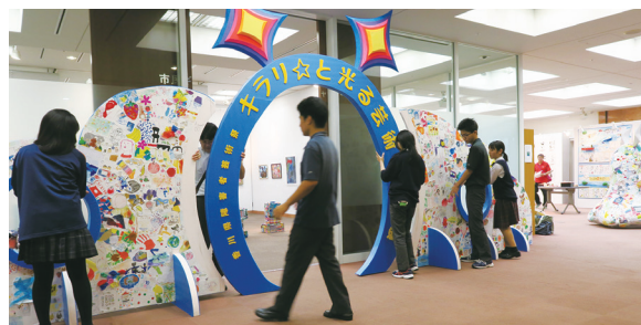
美術系 イベント前日のファサード設営の様子

協力してくださった認知症カフェのスタッフの感想には、「役割分担もそれぞれが得意とすることを担当されていてすごく良かったと感じました。今回、高校生主催の貴重な認知症カフェに参加できてとても良い経験をさせていただきました。色々な年代での交流ができ、生徒さんたちにたくさんの刺激や元気をもらえるカフェでした。」と、一所懸命に取り組んだ生徒の気持ちが一気に晴れ、確かな達成感を得ることができるお言葉をいただきました。カフェの運営後の現在もなお、福祉系の3年生は次年度の生徒に渡す資料を作成して後輩にうまく引き継ぎができるよう工夫をしている最中です。