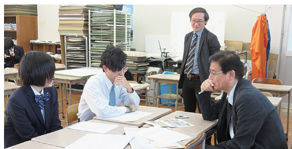
美術系生徒へのインタビュー

クト)の場合は、その時間でも不足するのではないですか?」と質問したところ、「文化祭や県のイベントに合わせるプロジェクトの場合は夏休みに活動を行ったりしています。その他のほとんどは系単位で授業の時間割を教員同士が調整することでなんとかやっています」とのことでした。ここにも多様なコースを持ち、教員の協働性が高い私立高校の良さが活かされていました。