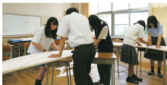
美術系 夏休みの作業の様子

所と3回の打ち合わせを行い、意見交換を通して作品のアイデアやスケジュール、安全性などを関係者全員で真剣に議論しました。また生徒は、ファサードを設置する現地(サンポート高松)を見学し、設置場所を確認し、生徒なりにイメージを膨らませていきました。生徒たちは話し合いを重ね5月にはファサードのデザイン案を決定しました。生徒のアイデアで、県を通じて特別支援学校の生徒に「好きなもの・こと」をポストカードに描いてもらい、集めたカードをファサードに貼り付ける、という内容の協力を依頼しました。カードは約720枚集まり、実際にファサードに貼り付けることができました。また、一部生徒は障害者施設を訪問して、「ともに過ごす」ことの大切さを実感する機会も得ることができました。