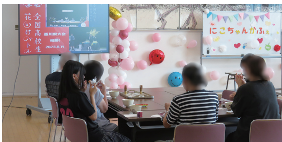
福祉系「にこちゃんかふえ」お茶会の様子

運営内容としては①総合コーススポーツ科学系が考えた介護予防体操(内容は福祉系から依頼)、②福祉系の考えたレクリエーション、③お茶会などでした。実際のカフェの運営では、福祉系以外の生徒にも協力してもらいました。最後に今回サポートを依頼した認知症カフェ運営者による「認知症について」の講演をしていただき、来場者に認知症について理解を深めてもらいました。