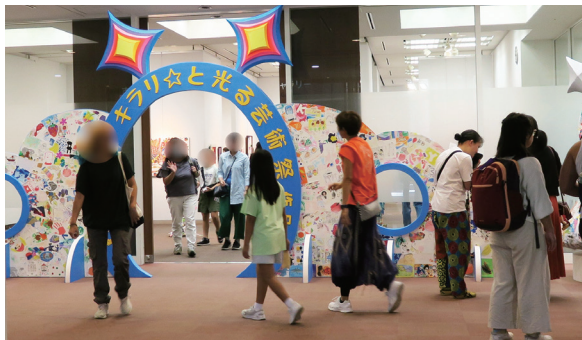
美術系 イベント当日参加市民の様子

イベントを盛り上げ、多くの市民から高い評価を得たことは、大きな達成感を感じるものとなりました。